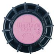
Identifikačný kryt úžitkovej vody pre PGJ

Dostupný ako štandardne nainštalovaný pri všetkých modeloch